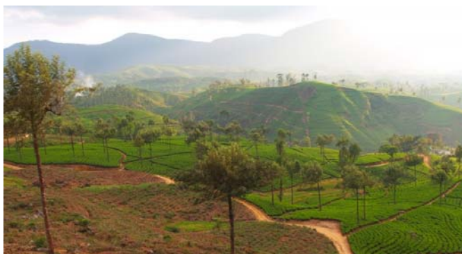
ヌワラエリアの茶畑