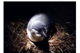
フェアリーペンギン 世界一小さい