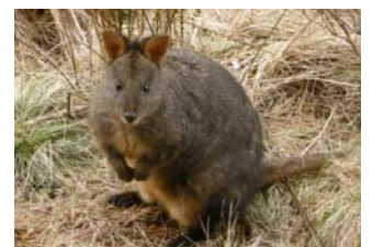
パディメロン クラビー属タスマニア固有種