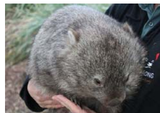
ウォンバット 人懐こい