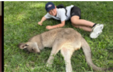
文化交流・オーストラリア観光