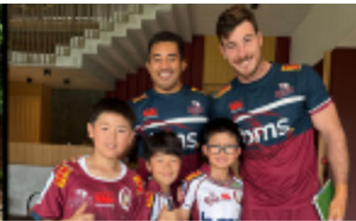
プロ選手との練習・交流イベント